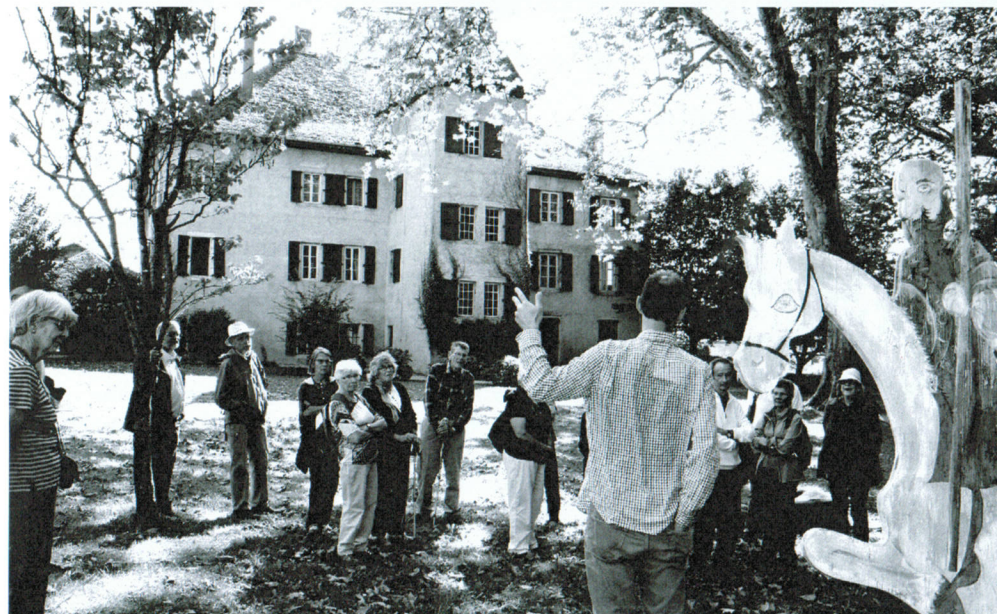
Verrée finale au château d'Eclépens.