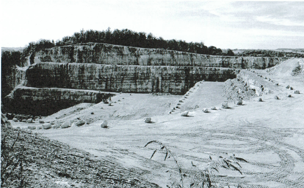
Le site de la carrière d'Holcim.

terrestre, l'europpéenne et l'africaine, glissent l'une sur l'autre – un livre «Jurassique suisse» de Robin Marchand paraît ces jours-ci à ce propos. Aujourd'hui, la cimenterie Holcim exploite ce calcaire et le transforme sur place dans son usine d'Eclépens, construite en 1953 par la Société des chaux et ciments de la Suisse romande.