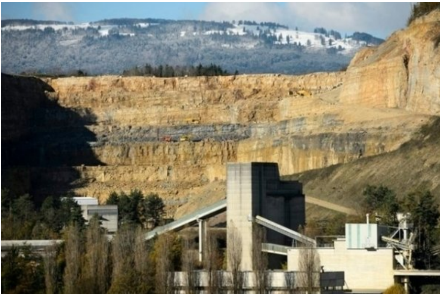
La carrière du Mormont du cimentier «Holcim» photographiée en 2013 à Eclépens.

Une nouvelle tranchée de plusieurs centaines de mètres suscite une vive réaction des milieux de défense de la nature. Ils ont déposé un second recours.